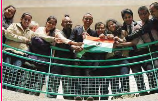
Une quinzaine d'étudiants indiens de Bangalore ont passé un semestre à l'ESC de Pau.