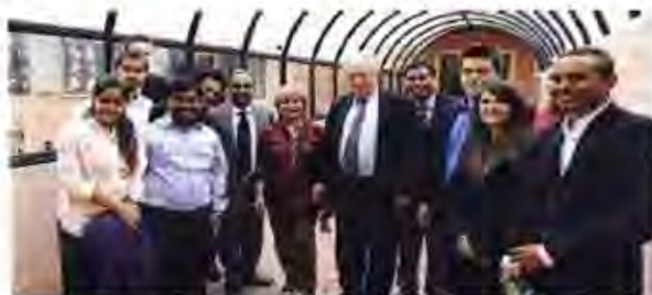
Une délégation indienne était à Pau pour fêter l'événement.